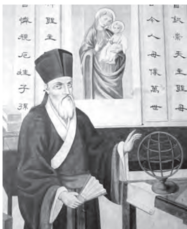
· 利瑪竇神父穿上儒生服飾

洗。可惜，約在 1368 年，隨著蒙古王朝的結束和明朝的開始，中國的首個天主教傳教區也隨之消失。中國第一浪的天主教傳教活動持續不夠一個世紀，但第二浪勢如倒海，在中國文化留下不可磨滅的痕跡，今天依然清晰可見。展開這第二浪傳教活動的，是一位傑出的語言學家兼聖德卓越的耶穌會會士——利瑪竇神父。